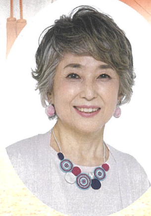
トークイベント 俳優 竹下景子

2024年12月20日(金) 14時開演 奈良春日野国際フォーラム 薨~I・RA・KA~